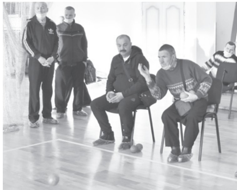
Спортсмены сыграли в шашки, дартс и бочче.