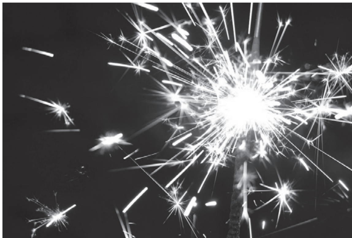
|| Фото с https://pixabay.com/ru/photos/

4. Внимательно осмотрите выбранное место: по соседству (в радиусе 100 метров) не должно быть пожароопасных объектов, стоянок автомашин,