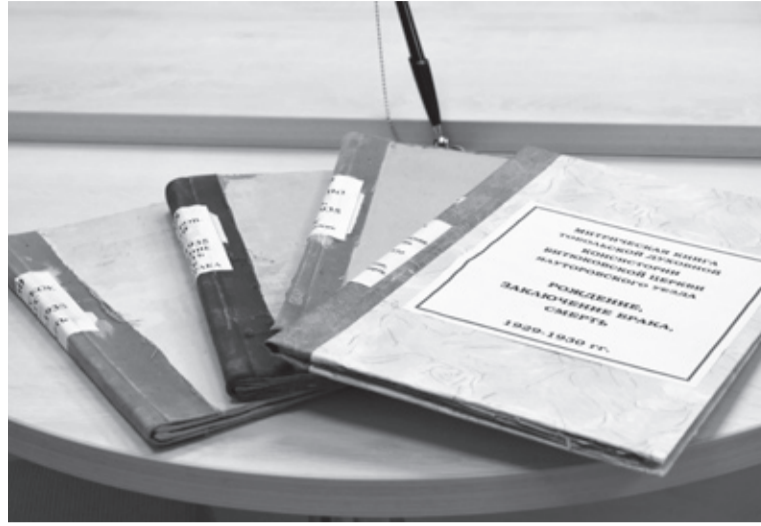
|| Архивные книги советского периода.

1 « Все действия фиксируются и остаются в архивах этих учреждений.