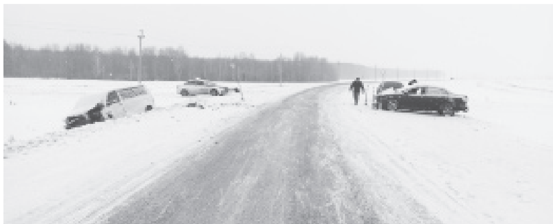
|| Фото ГИБДД

18 декабря «Toyota» и «Volkswagen» столкнулись на 115-м километре автодороги Шадринск-Ялуторовск. 47-летняя водитель «Toyota», жительница с.Исетское, была доставлена в больницу, где скончалась от тяжелейших травм. Ранены двое пассажи-