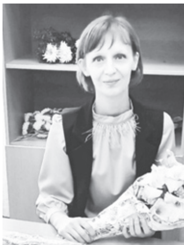
|| Фото из личного архива Ирины Пугачёвой

Помимо уроков Ирина активно занималась спортом, участвовала в художественной самодеятельности и обще-