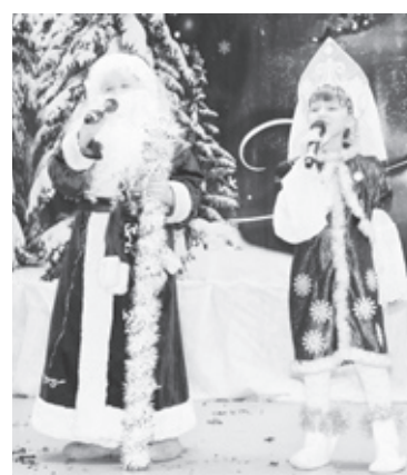
|| Моменты конкурса.