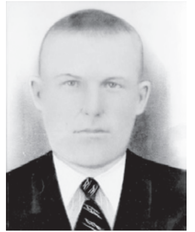
Иван Кунгуров.

Была она добрейший человек и мудрейший. Я, как старшая её внучка, помню, что не одной свадьбы в деревне не пропустила. Всегда с бабой Ориной ходила смотреть, как жених за невестой на тройках лошадей приезжал. А для украшения свадебных троек бабушка умела делать очень красивые цветы из гофрированной бумаги, а ещё для невест она очень красиво пришивала к вуали венки из парафиновых цветочков. К бабушке часто обращались будущие молодожёны с этими просьбами, и она с большим удовольствием исполня-