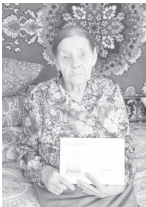
|| Фото автора

— Я к тому времени уже в яровском колхозе на быках трудилась, бригадиром были женщины, старики, которые оставались в деревне. Очень мучил голод, когда сил не оставалось, отпустили быков траву пощипать, а сами искали в полях пучки — срывали эти