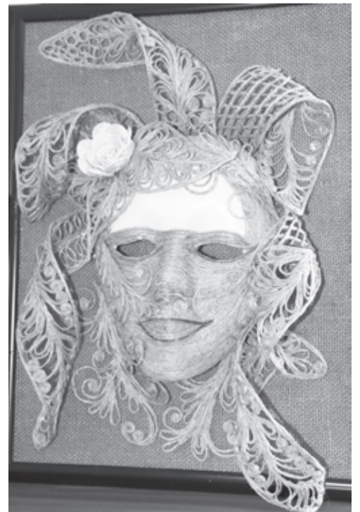
|| Свободное время Надежда Яковлевна посвящает рукоделию.