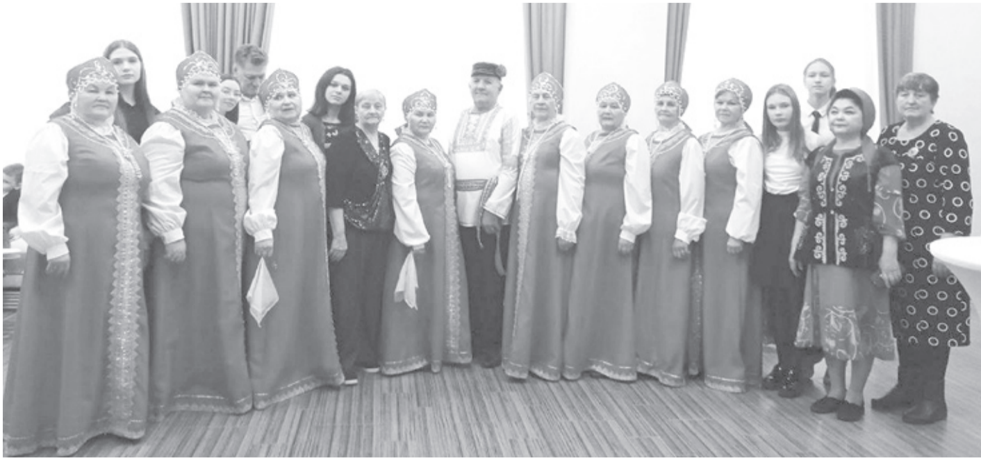
|| Фото из архива солобьевского музея