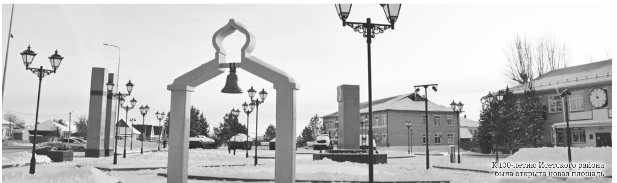
К 100-летию Исетского района была открыта новая площадь

Реорганизация верхнеингалской восьмилетней школы в среднюю, 1994 год