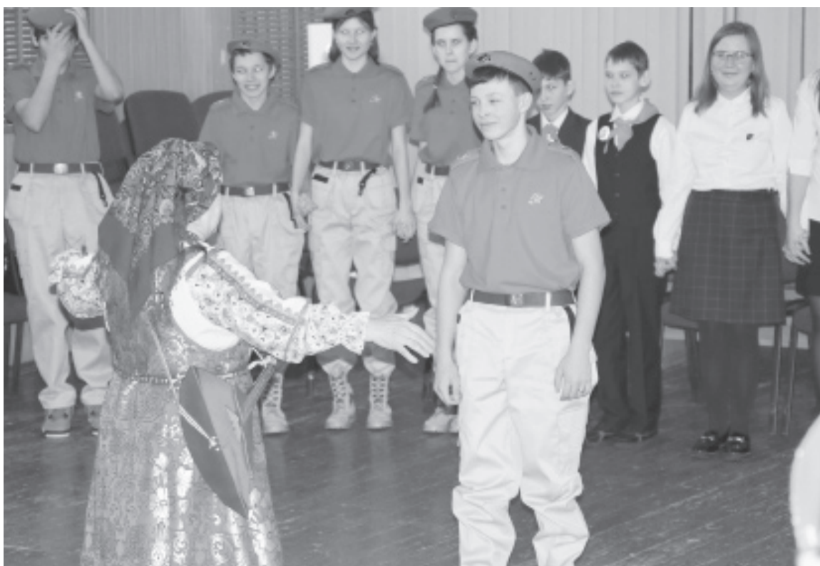
|| На форуме провели в том числе и интерактивную образовательную программу «Хороводы России».

Мальчишки и девчонки на форуме написали письма солдатам, рассказав историю, когда подобная весточка от школьника спасла жизнь бойцу: военнослужащий, потеряв письмо при смене позиции, вернулся на прежнее место, а туда, где он только что был, прилетел снаряд.