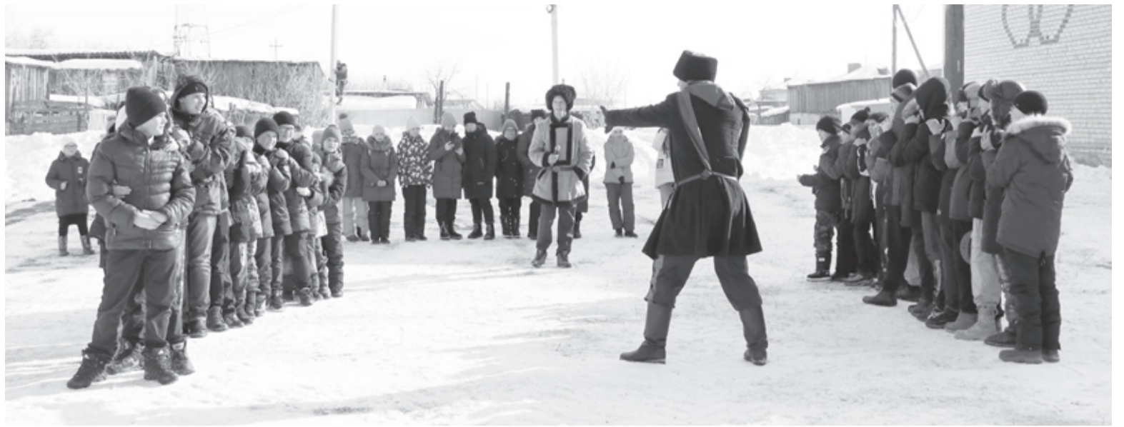
На форуме школьники познакомились и с традициями казачества.