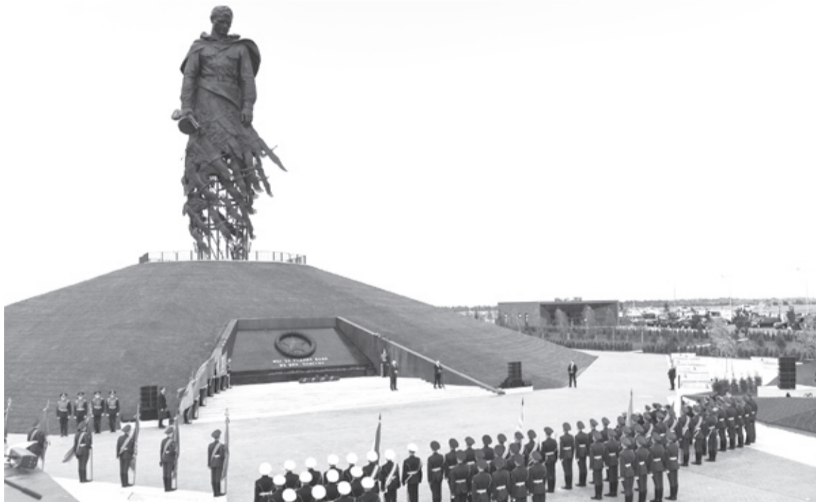
|| Ржевский мемориал.

Ржев был занят немецкими войсками 24 октября 1941 года. Освобождали город с января 1942 по март 1943 года.