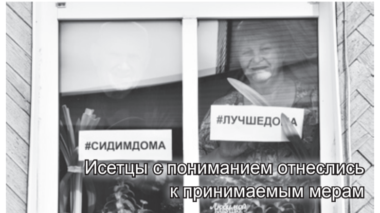
Исетцы с пониманием отнеслись к принимаемым мерам