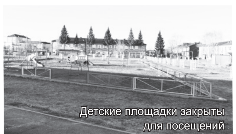
Детские площадки закрыты для посещения