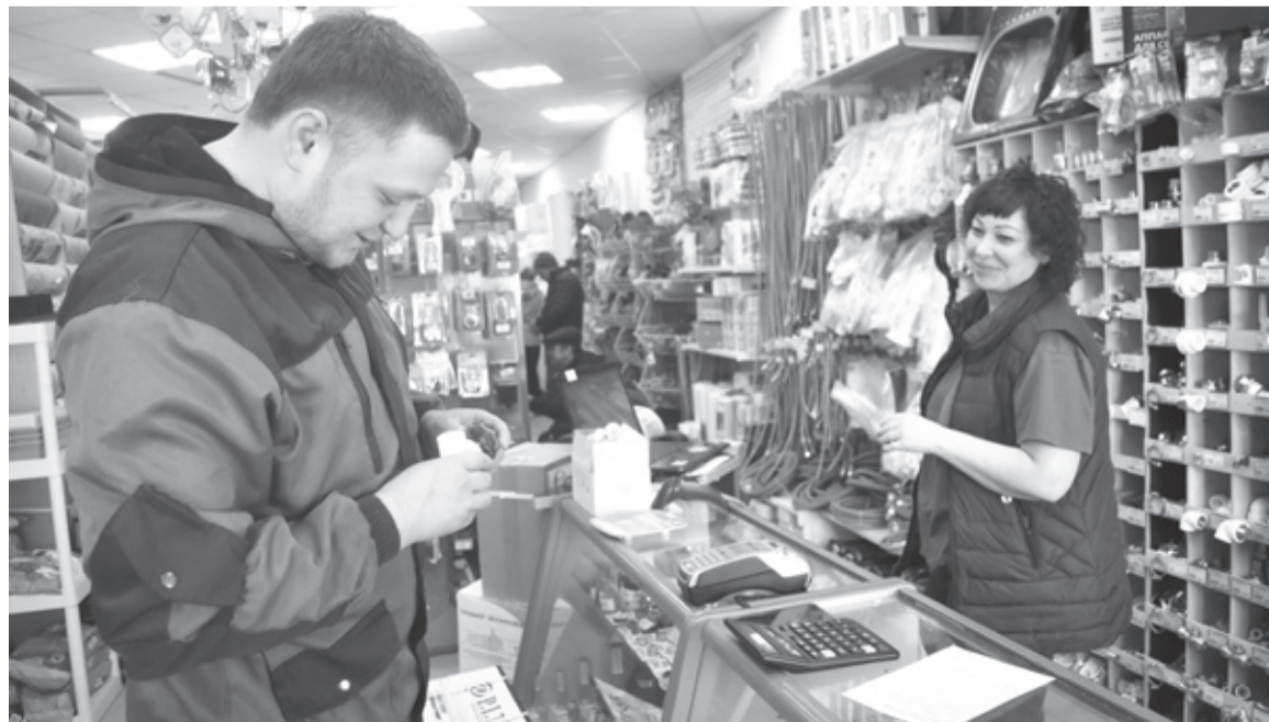
Приветливые продавцы всегда встречают покупателей с улыбкой.