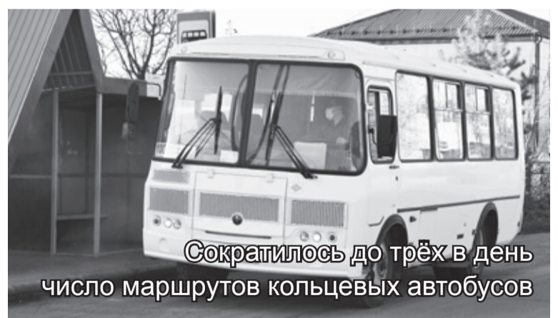
Сократилось до трёх в день число маршрутов кольцевых автобусов