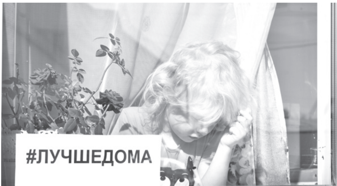
|| Фото Лики Патраковой

Семья Фоминых из райцентра уверена, что все неудобства, связанные с ограничительными мерами по нераспространению