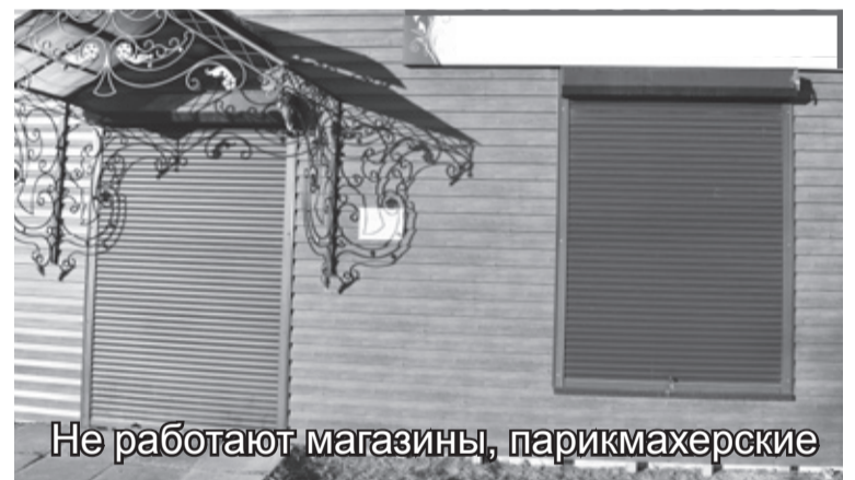
Не работают магазины, парикмахерские