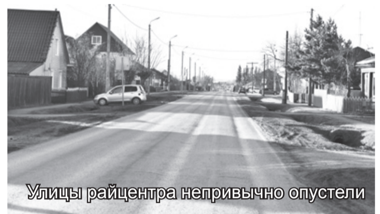
Улицы райцентра непривычно опустели