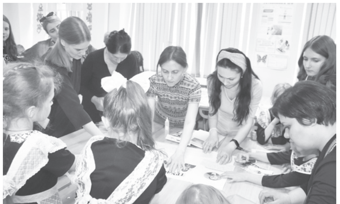
|| Фото автора

Интереснейший материал и экспонаты были представлены на станции «Старообрядчество. Двоедане». Красновоцкие педагоги рассказали, что образ жизни старообрядцев, уклад, традиции, обычаи были на-