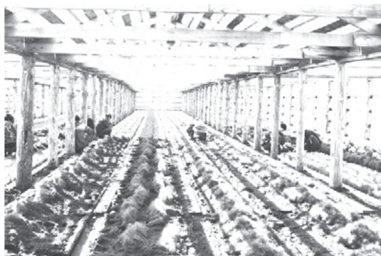
Хорошим подспорьем для лесовосстановительных работ служит собственная теплица, где выращивается свой посадочный материал.