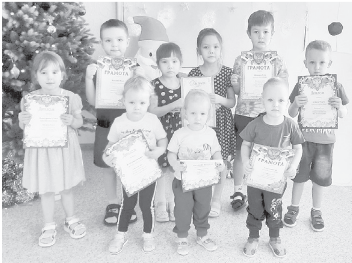
|| Фото из архива детского сада "Росинка"