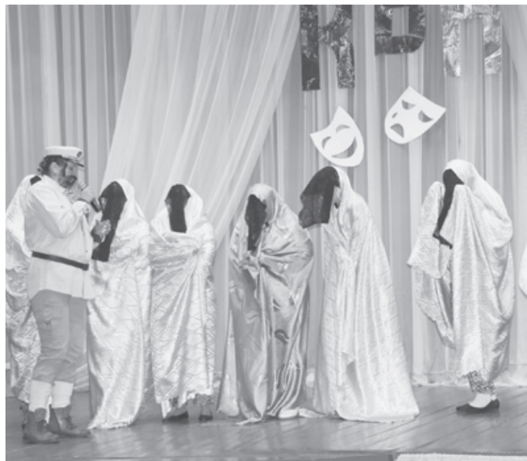
|| Команда школы «Вечная молодость»

Члены жюри отметили, что с каждым годом уровень рафайловских юмористов только растёт, наблюдать за соревнованием интересно и увлекательно. Для участия в следующем году уже готовится команда поселения, так что зрителей ждёт не менее захватывающая встреча, в которой, конечно, победит самый весёлый и находчивый.