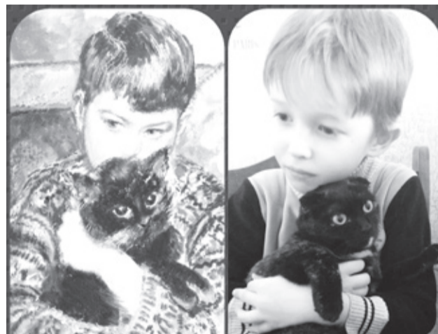
|| Картина Л.Ланкастер «Мальчик с котом» и Арсений Шапошников