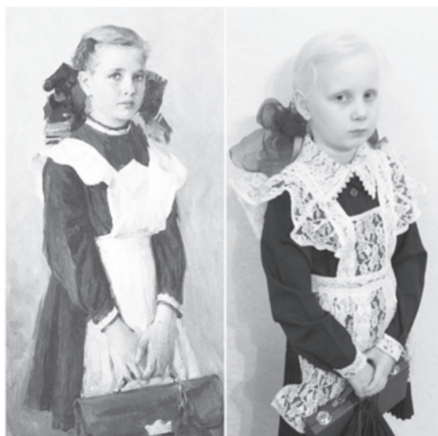
|| «Портрет дочери» Л.Лесницкой и Света Коробейникова