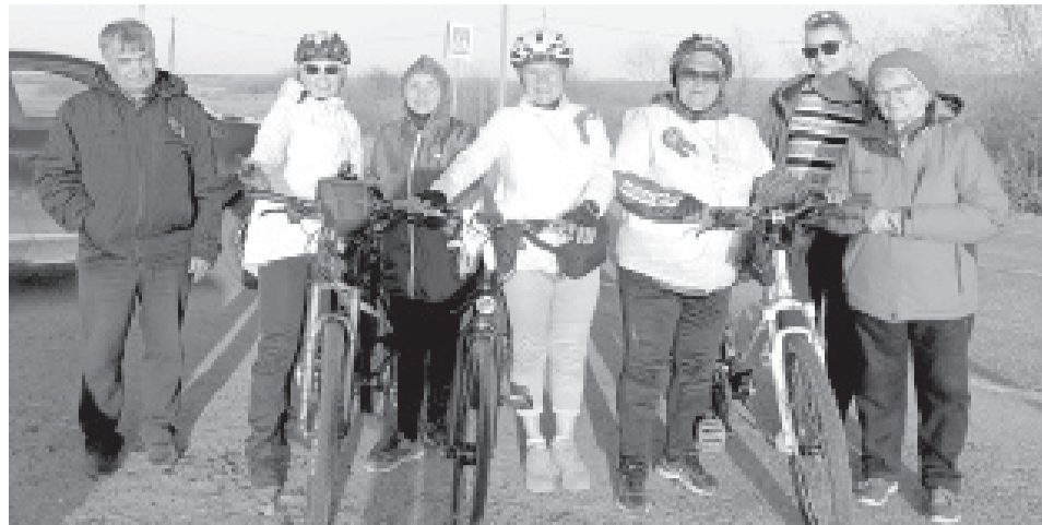
|| Фото Евгения Визирю