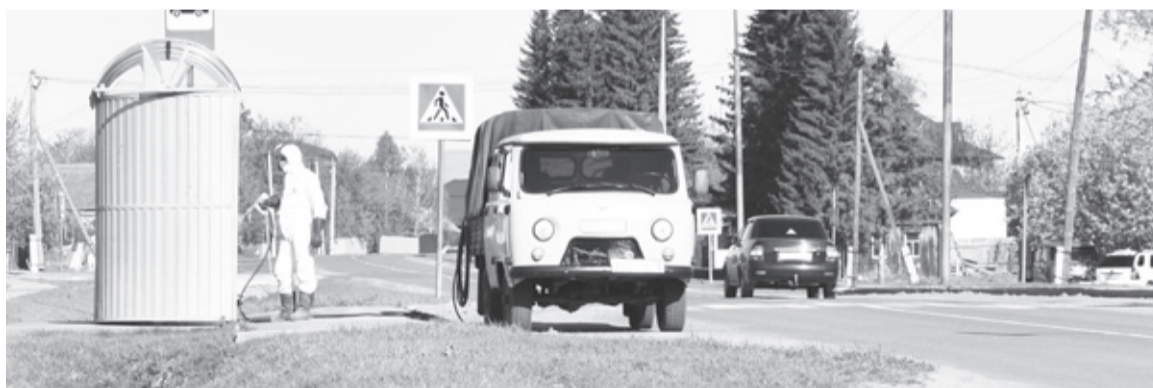
Остановочные комплексы в райцентре ежедневно обрабатывают дезинфицирующими растворами.

Для получения масок и за более подробной информацией необходимо обратиться в диспетчерскую службу центра «Забота» по телефону: 8 (34537) 211-7-67.