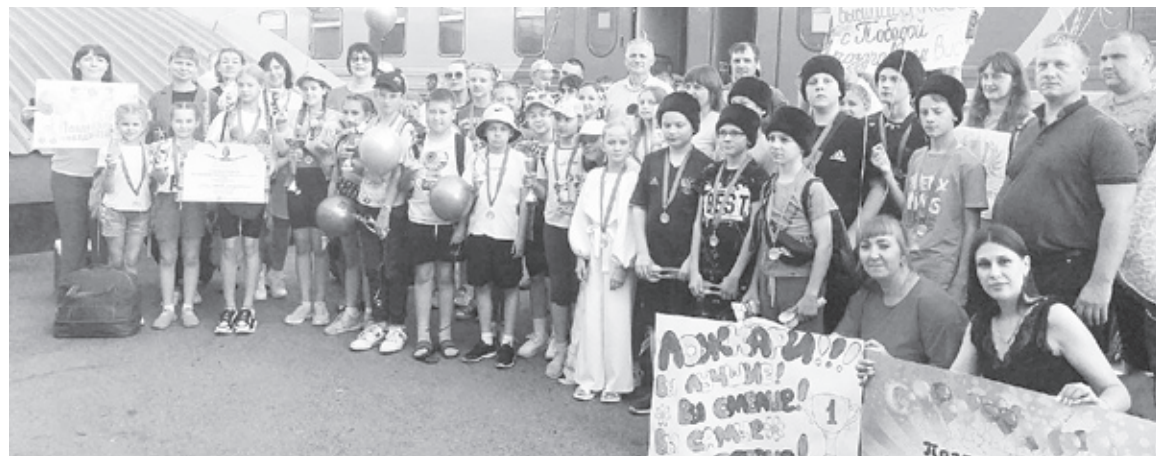
|| Юных артистов торжественно встретили на железнодорожном вокзале.

Старший состав «Исетских задоринок» показал «Случай на корабле» и «Тарантеллу», средний - «Ложки удалые» и «Крыжачок», за что и признаны лауреатами второй и третьей степени каждый. Также танцоры заняли второе место среди всех коллективов, принимавших участие в конкурсе, получили денежный сертификат и приглашение в Москву для участия в этом же конкурсе в следующем году. Ансамбль ложкарей «Сибирские забавы» за русскую народную