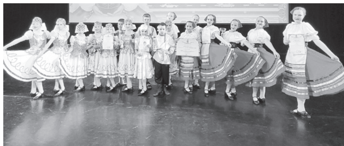
|| «Исетские задоринки».

- Действительно, это уникальный шанс показать себя. Выступление на конкурсе такого уровня очень значимо. Серьёзные, сильные соперники не дают расслабиться, заставляют работать, выкладываться в полную силу. Результаты, которых добились наши дети, очень хорошие. Они достойны всех этих овец. Здорово, что у ребят была возможность не только побывать на конкурсе, но и узнать интересные факты о красивейшем городе во время экскурсии. Эта поездка им запомнится надолго, - добавляет мама воспитанника хореографического коллектива.