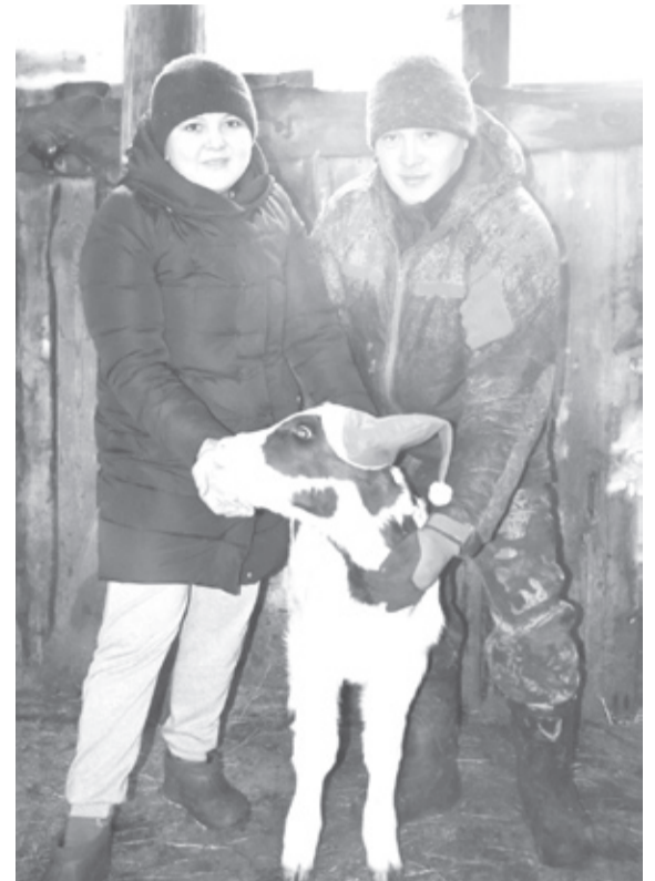
|| Фото автора

Как и подбавляет мужчине, глава семьи не представляет стол без мяса, в основном это конина.