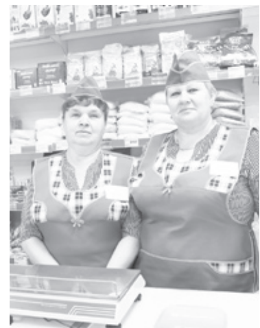
|| Коллектив гаёвского магазина