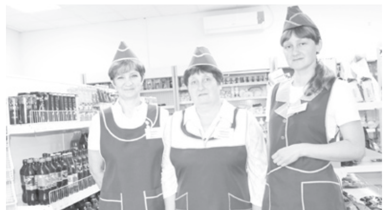
|| Коллектив бархатовского магазина