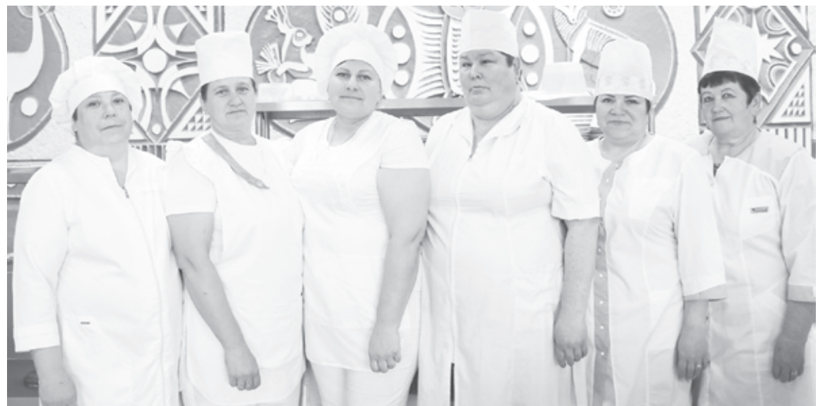
|| Коллектив столовой.