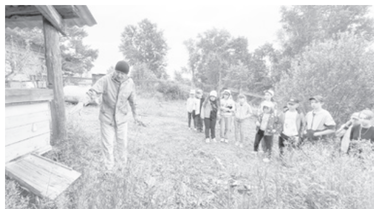
|| Фото из архива бобылевской школы

Участвуя и побеждая в общелагерных мероприятиях, ребята зарабатывают Звездочки, которые идут в отрядную кассу. Этими «деньгами» разрешено оплатить плавание всего отряда в бассейне, экскурсию с вожатым и ответ-