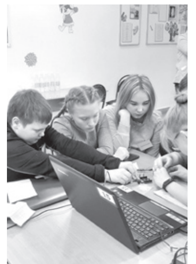
Школьники Исетского района учились программировать.

Как отмечают организаторы хакатона, ребята были увлечены процессом программирования и проявили большой интерес к теме игры. Напомним, что шороховская школа стала победителем в областном конкурсе «Айти-актив-2019», по результатам которого выиграла учебный класс по робототехнике РОБОлаб. В ближайшее время он начнёт работать для шестиклассников.