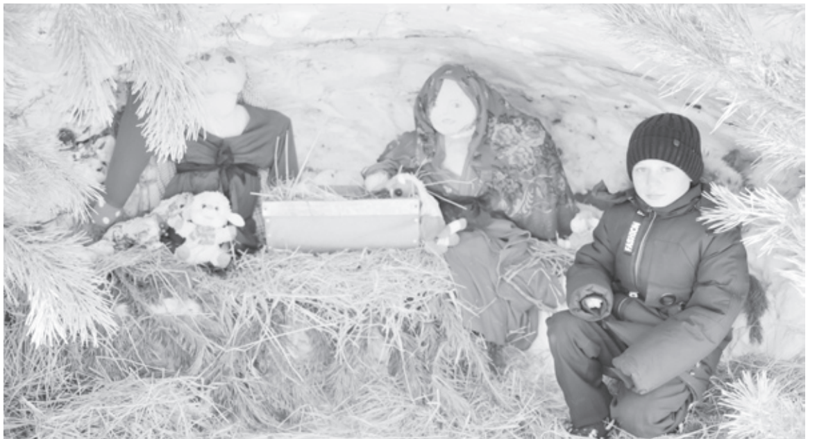
|| Рождественский вертеп.

– Разукрашивать фигуры интересно, но сложно. Краска стекает, поверхность неровная, скользкая. С подружкой Мариной часто сюда приходим, лю-