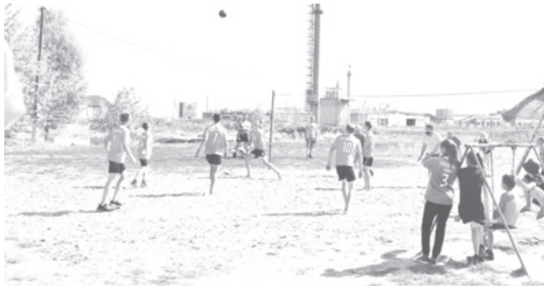
|| Один из популярных видов спорта – волейбол.

возможным жизненным трудностям, закаляет характер, патриотизм для него не просто слово.