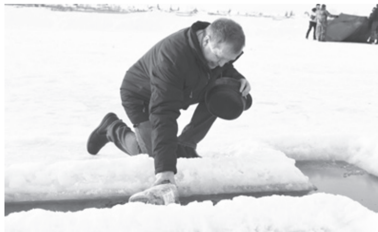
|| В Крещение исетцы окунались в иордань и набирали святую воду.