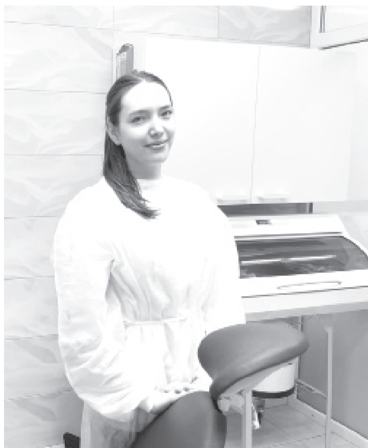
|| Фото из личного архива Аллы Старцевой