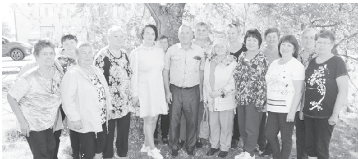
|| Фото из архива райсовета ветеранов

Мы побывали в селе Верхнебешкиль, вели разговор о трудовых победах колхоза "Память Кирова". Второй визит – в село Красново. А здесь был колхоз "Сибирь", крепкое сельхозпредприятие, урожайное и мясо-молочное. Помним