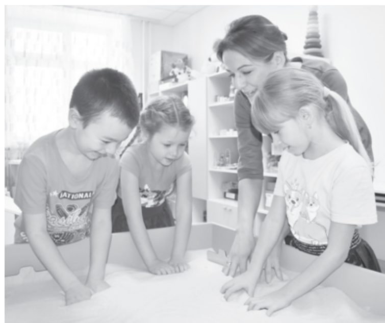
Ребятам нравятся развивающие и интерактивные игры.

– Очень рада, что мы собрали команду, фронт работы огромный, и сообща её легче будет выполнить. Добавились ценные сотрудники, которые уже