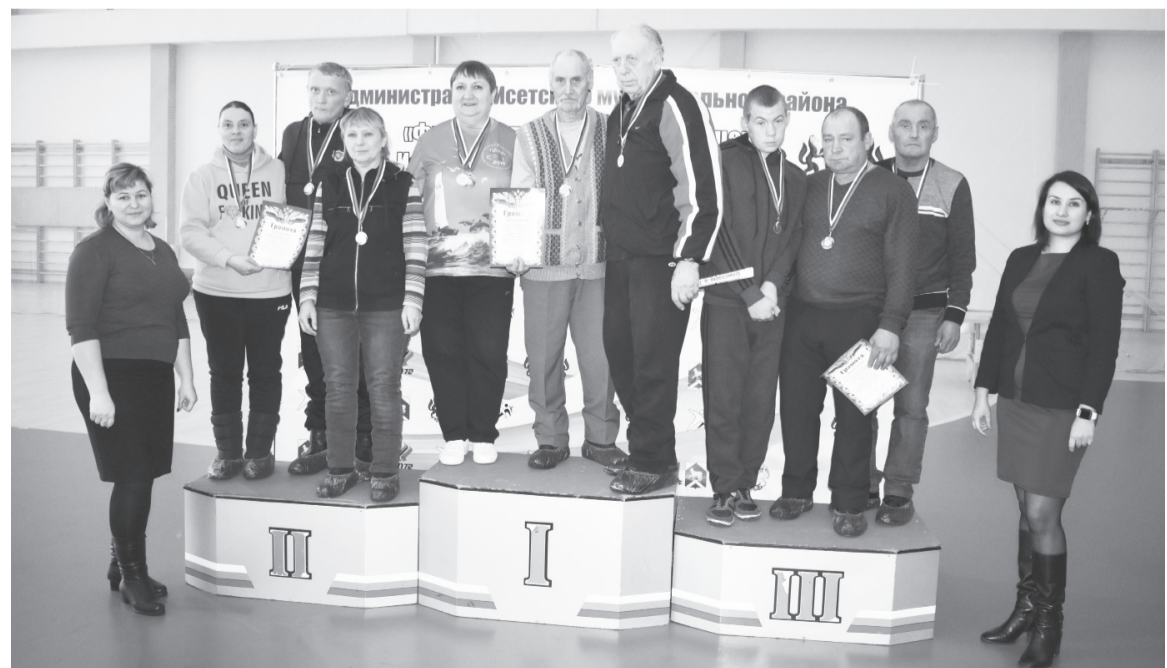
|| Призёры соревнований по бочке.

В бочке в тройку призёров вошла команда Слободобешкильского поселения, второе место взяли шороховцы, первое заняли мининцы.