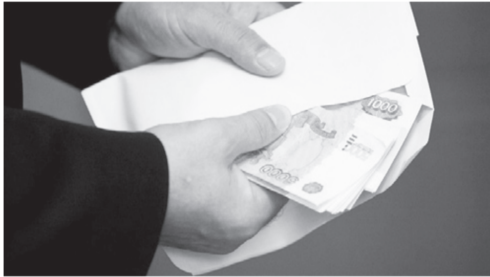
|| Взятка – один из видов коррупционных деяний.

– При совершении обгона водитель допустил пересечение сплошной линии дорожной разметки, – рассказывает Андрей Александрович. – Чтобы избежать привлечения к административной ответственности, мужчина предложил взятку сотруднику ДПС. Полицейские задокументировали факты попытки подкупа, материалы были переданы в органы предварительного расследования. Уголовное дело по обвинению этого мужчины по части 3 статьи 30, части 1 статьи 291.2 Уголовного кодекса Российской Федерации впоследствии передали в суд. С учётом положительной характеристики и того факта, что ранее мужчина не привлекался к уголовной ответственности, а также его раскаяния суд назначил наказание в виде штрафа в размере десять тысяч рублей. По данной статье штраф