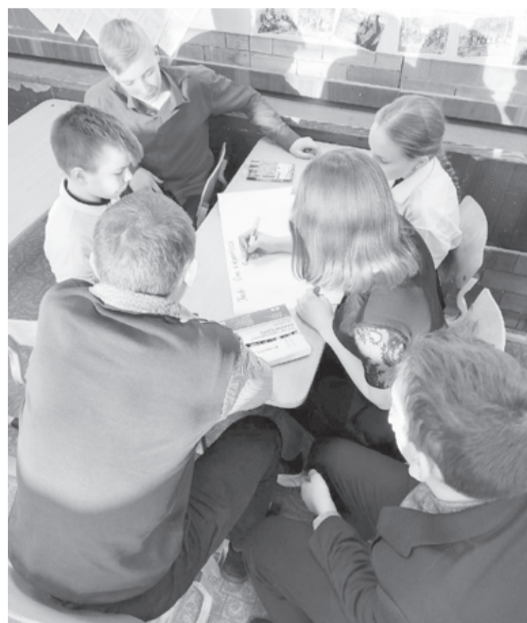
|| Школьники готовятся к профилактической акции.

Неоднократно волонтерский отряд «Данко» становился победителем творческих соревнований. Так, в 2013 году